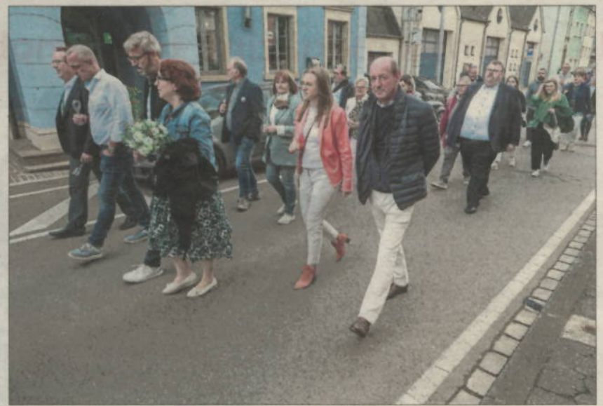
Der traditionelle Umzug durch Wormeldingen.