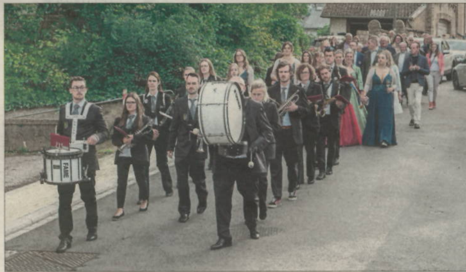
Auch für die musikalische Unterhaltung war gesorgt.