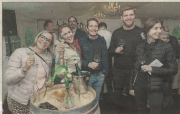
Bei 18 Winzern konnte probiert werden.